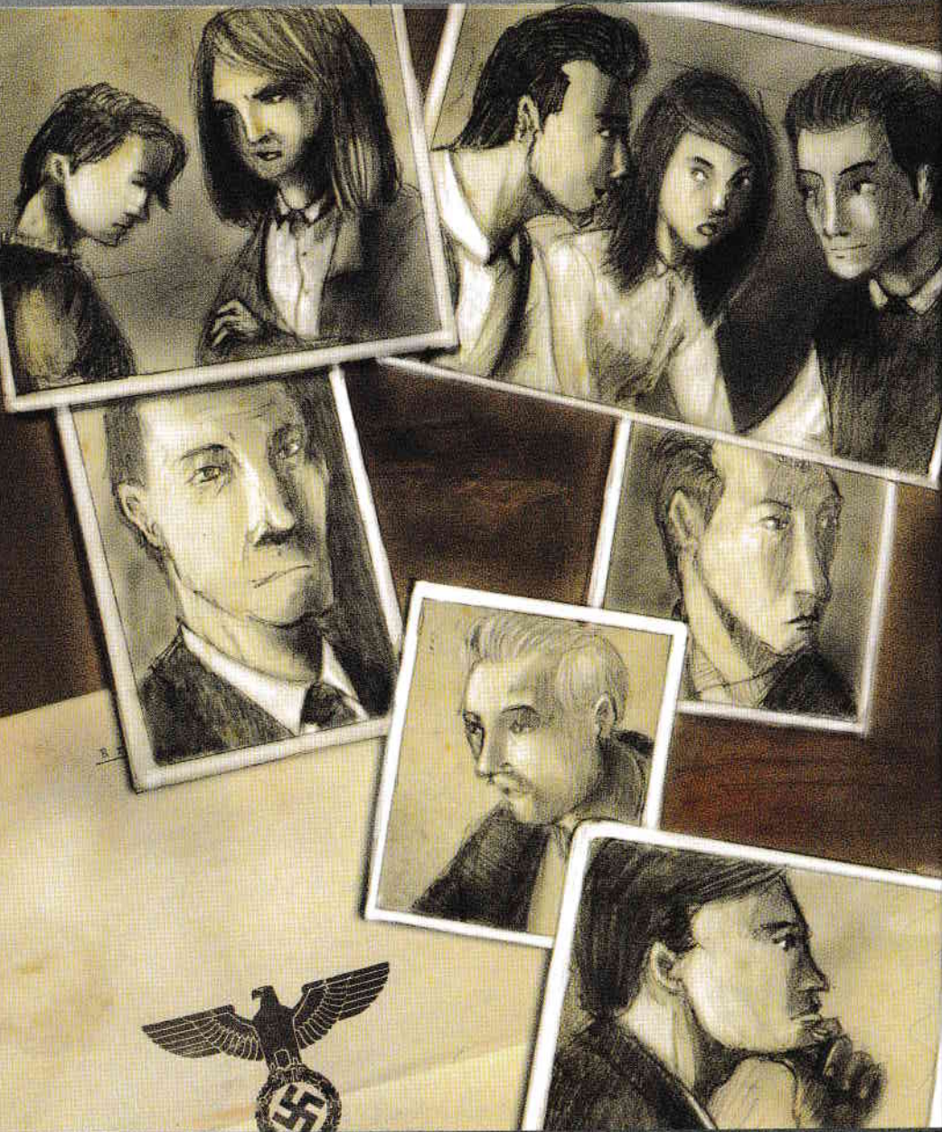
Von links nach rechts und von oben nach unten: Sophie und ihre Mutter; Hans, Sophie und Christoph Probst; der Vater; Kurt Huber; Willi Graf; Alexander Schmorrell